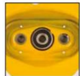
Rodamiento de bola en la tapa del engranaje