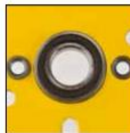
Rodamiento de bola en la placa lateral